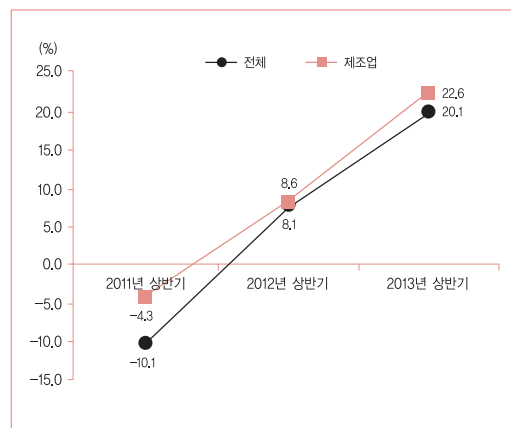
[그림 3] 의료기기 상장기업의 총자산 및 유형자산 증가율